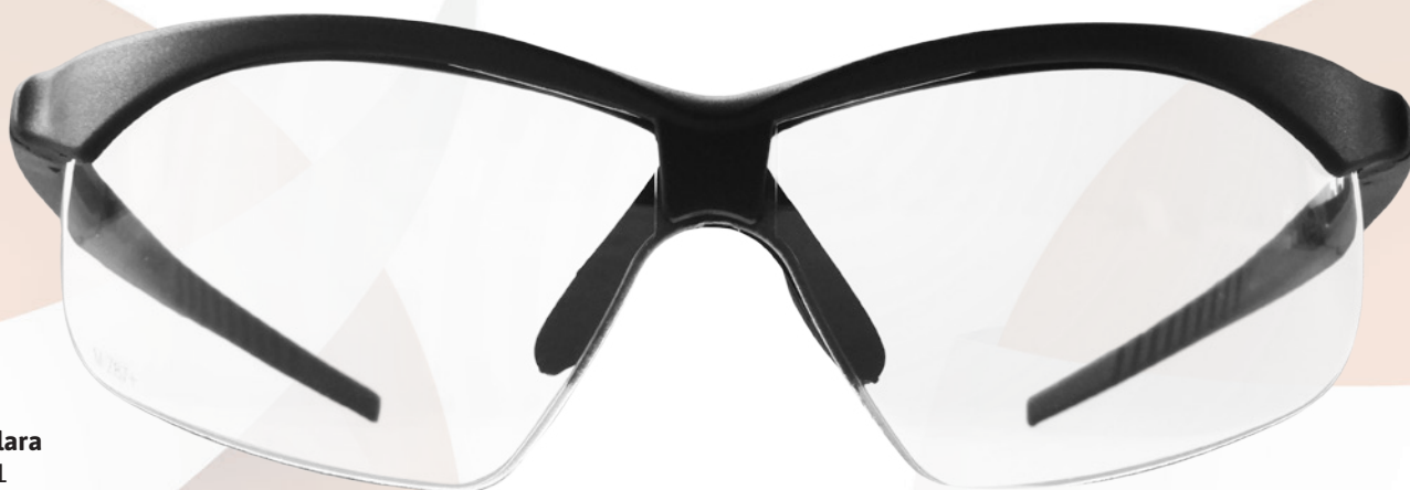
Mica Clara LS-3001