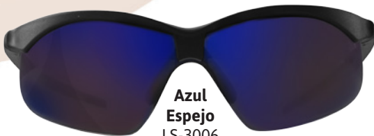
Azul Espejo LS-3006

La familia de lentes de protección ARCHER, están fabricados de policarbonato, proveen una protección del 99.99% contra rayos ultravioleta UVA/UVB y protección contra impactos. Su diseño se adapta perfectamente al rostro logrando así mayor comodidad y protección. Ideal para utilizarse en sitios en donde el operador este expuesto a riesgos de impacto en los ojos.